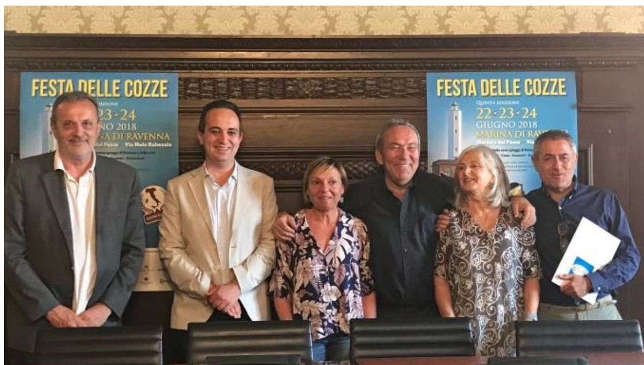
Festa delle Cozze

Ultimo aggiornamento: 11 giugno 2018 ore 18:45