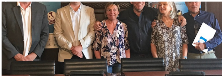
La Festa delle Cozze presentata oggi in Municipio a Ravenna