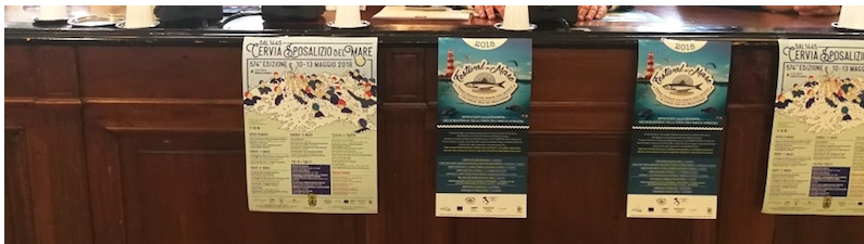
Nella foto la conferenza stampa di presentazione