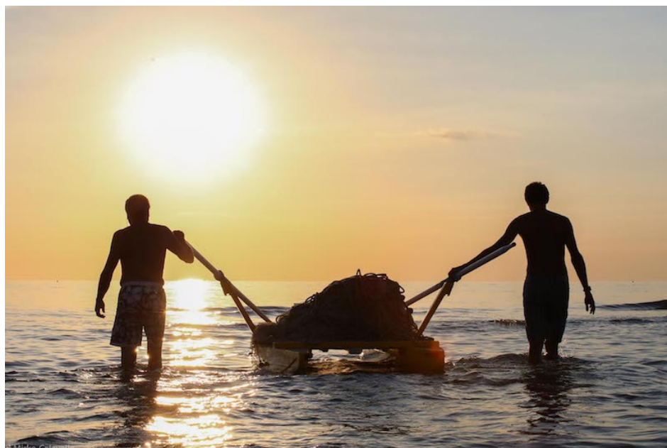
Pesca da terra