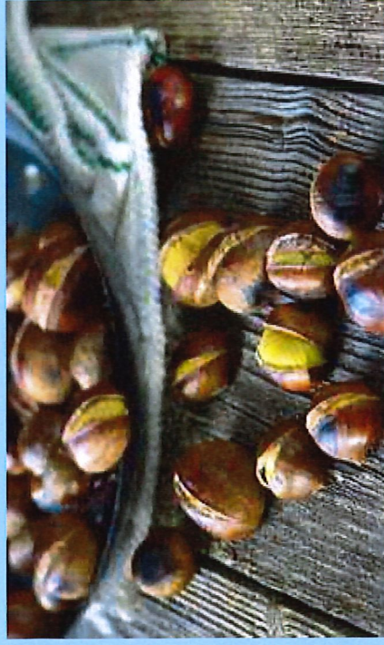
SIMBOLI - Castagne e vin brulé sono due delle tipicità dell'autunno