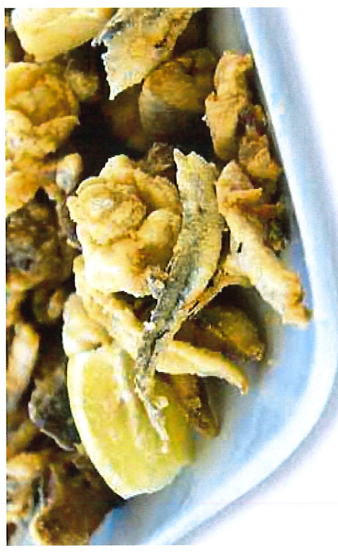
FOCUS - Il pesce utilizzato è tutto pescato nel Mare Adriatico

Cesenatico si trasforma in un grande ristorante per la manifestazione gastronomica "Il Pesce fa Festa". Dal 31 ottobre al 4 novembre lungo il porto canale, nelle piazze e nelle vie del centro storico trionfano grigliate di pesce, frittiture e piatti della tradizione marinara. Nel centro storico troveranno spazio gli stand del gruppo di volontari, delle Associazioni di pescatori e degli chef di A.R.I.CE. (Associazione Ristoratori Cesenatico) e A.R.T.E. in Cucina che prepareranno alcuni piatti tipici della cucina marinara romagnola mentre nella zona portuale di Ponente, nei pressi del vecchio Squero, la Cooperativa Casa del Pescatore, all'interno di una tensostruttura molto capiente, elaborerà antipasti a base di cozze e vongole, primi succulenti e le classiche "rustide", il tutto condito con intrattenimento musicale. E poi ancora la cucina marinara a bordo delle motonavi turistiche ormeggiate sulla banchina del porto canale e le proposte dell'Associazione Chef to Chef con le preziose ricette degli chef stellati di Cesenatico.