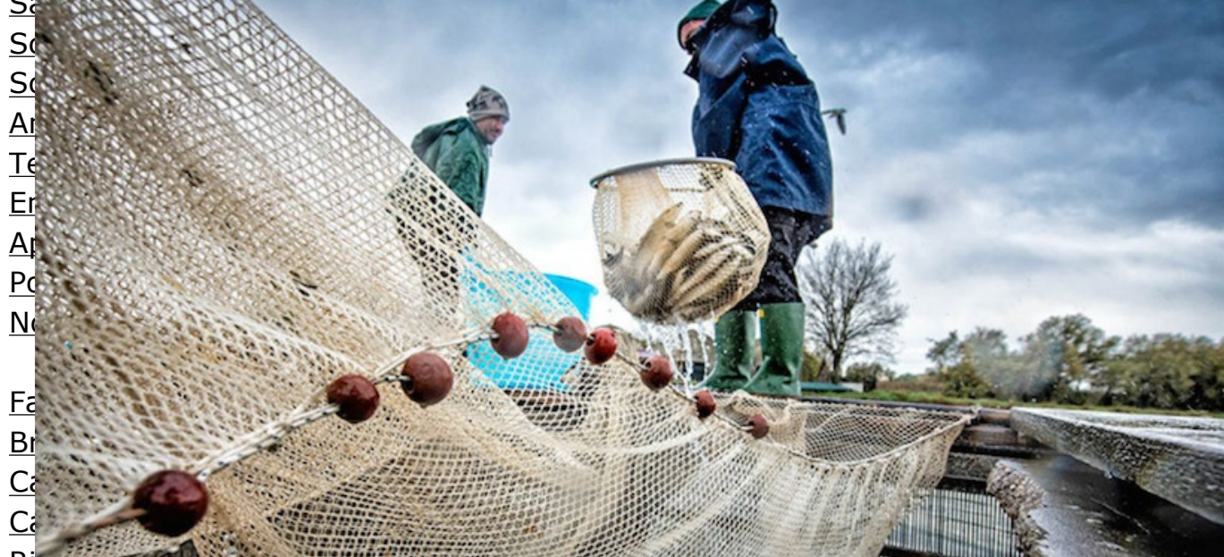
Immagine di repertorio