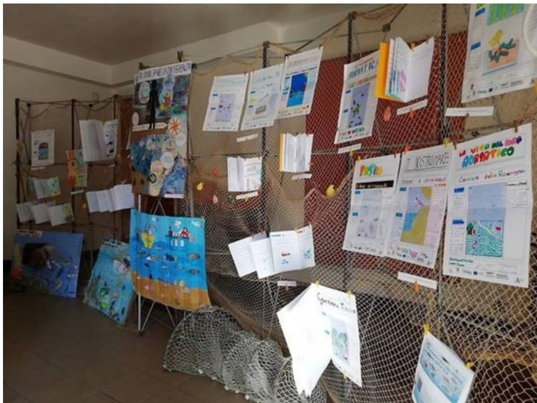
Alcuni dei ragazzi premiati e alcuni dei loro elaborati presentati durante il convegno conclusivo

Per ulteriori informazioni: info@deltaduemila.net ( mailto:%20info@deltaduemila.net ), www.flag-costaemiliaromagna.it ( http://www.flag-costaemiliaromagna.it/ )