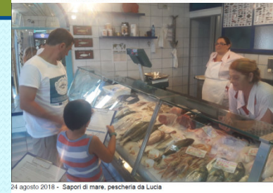
24 agosto 2018 - Sapori di mare, pescheria da Lucia