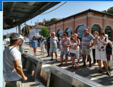
30 agosto 2018 - Pesca e territorio, incontro con il pescatore

Visite guidate ai luoghi della pesca (consorzi, laboratori, ..)