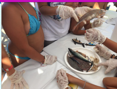
20 luglio 2018 - I signori del mare, laboratorio di riconoscimento delle specie ittiche