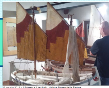
25 agosto 2018 - Il Museo e il territorio, visita al Museo della Regina